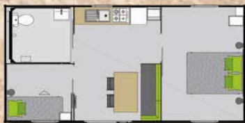
Mobil-Home 4 à 6 pers. 34 m 2 «IBIZA PMR» + RAMPE D'ACCES