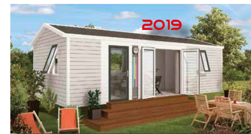
2019 Mobil-home «BAHIA DUO» 4 à 6 pers. 34 m 2 Grand Confort