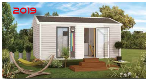
2019 Mobil-home «IBIZA SOLO» 2 à 3 pers. 23 m 2 Grand Confort