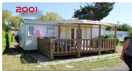
2001 Mobil-home «STANDARD» 4 pers. 27 m 2