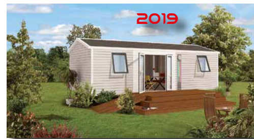
2019 Mobil-home «IBIZA DUO» 4 à 6 pers. 30 m 2 Grand Confort