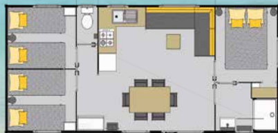
Mobil-home 6 pers. 37 m 2 «SANTA FÉ TRIO»